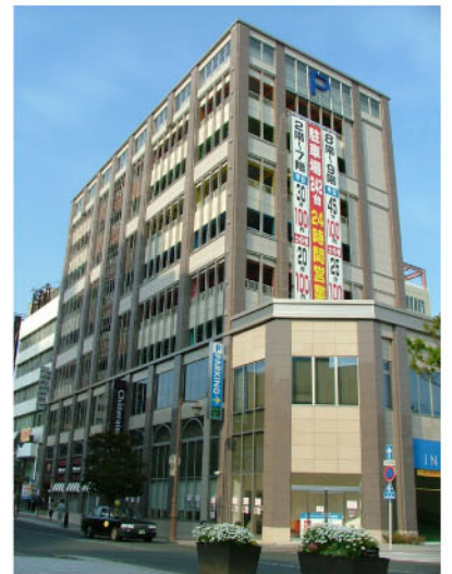
クロスロードパーキング所在地