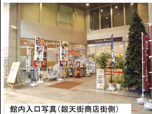
館内入口写真(銀天街商店街側)